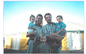
la giovane famiglia Gaglione

Ho chiesto a Dio 100 anni di vita, e gli ho chiesto di non farmi morire in un ospedale con tubi che mi escono da tutti i lati. Gli ho chiesto di farmi morire con le scarpe ai piedi, predicando il prezioso Nome di Gesu'. Sia