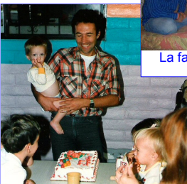
Crescendo figli nel campo di missione