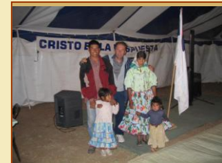
Una hermosa familia Raramuri