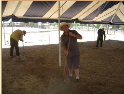
Hace mucho calor, en el dia 40 grados, de noche 3 cobijas no son suficientesveicolo regalato

Mucha gente se ira' al infierno por la negligencia de algunos critianos. La apatia y el desanimo estan haciendo estragos, y adonde no hay eso, las guerras entre hermanos dan el tiro de gracia.