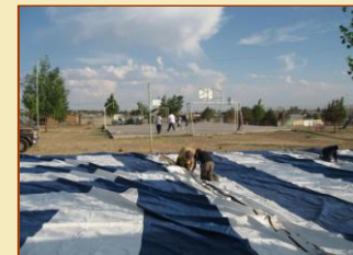
Preparando la red