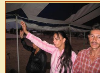
Adorando al REY