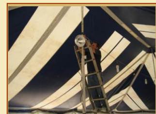
Las luces sirven