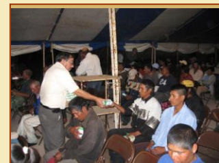
Un po' di latte, invece di alcool e droga