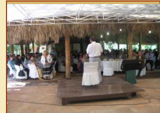
Ministrando a pastori e anziani nella bella Aguascalientes.