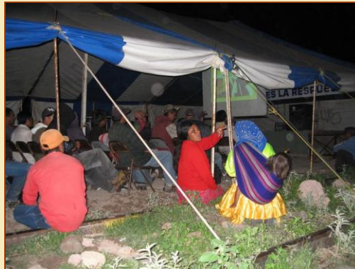
Agli Indios piacciono moltissimo i film.

Devo dire la verita', a prima vista uno sente molta compassione per questa