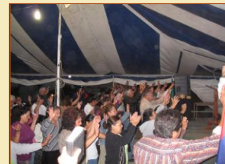
Chiamata all'adorazione e alla salvezza