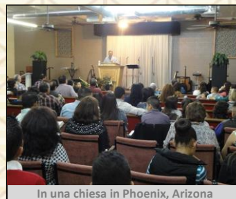
In una chiesa in Phoenix, Arizona