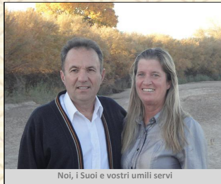
Noi, i Suoi e vostri umili servi

Anni fa Dio mi ha insegnato un principio, mi disse: preoccupati, prega, aiuta, prendi cura, pensa piu' agli altri, e Io, mi proccupero', prendero' cura, aiuterò e pensero per te.