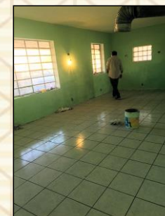
Prima era un deposito di vecchie ruote e olio di motore, ora una casa.