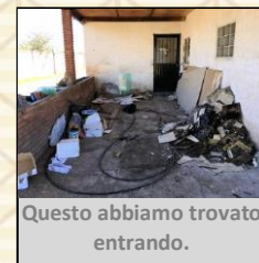
Questo abbiamo trovato entrando.