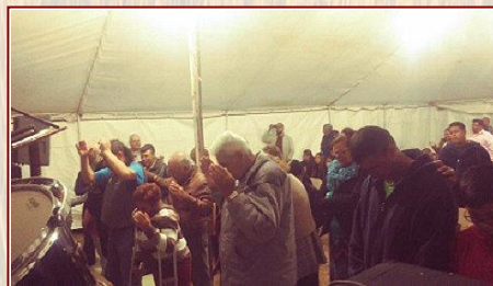
Bienaventurados los ..... seran saciados