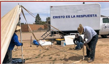
Preparando la red