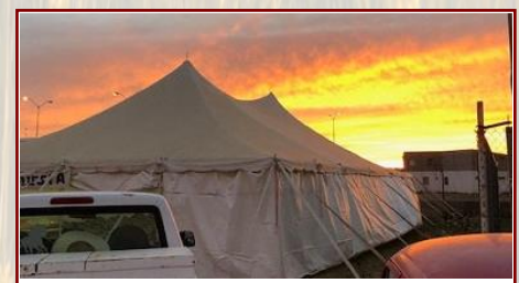
Adivina quien es el artista