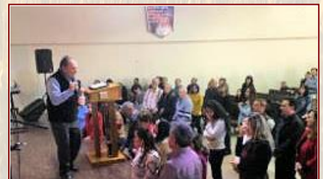
Un llamado a servir